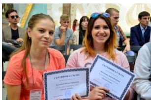
Слет для молодежи