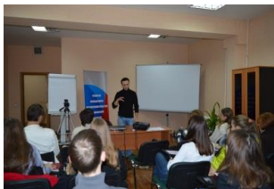
Школа «Основы молодежного предпринимательства»