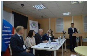
Региональный этап всероссийского Конкурса «Молодой предприниматель России»