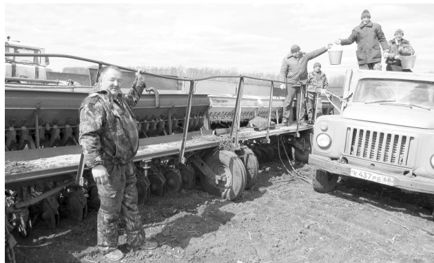
13.04.17 г. СХПК "Дружба"