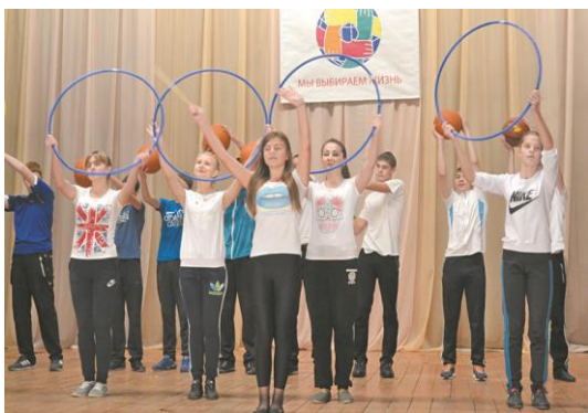
Выступление участников акции.