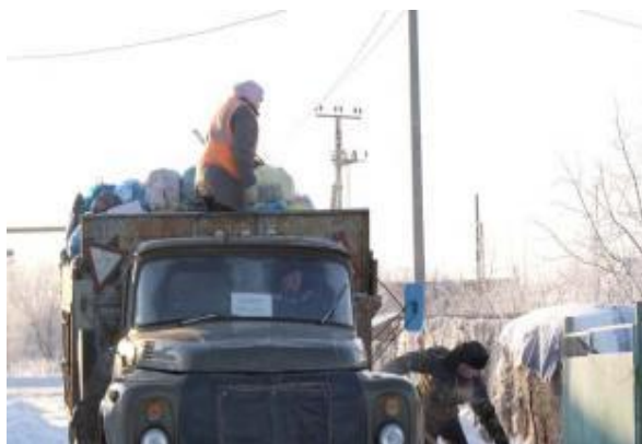
Вывоз мусора на ул. Западная

«О состоянии безработицы в районе и принимаемых мерах по её сокращению», «Оказание помощи гражданам Украины, покинувших места своего постоянного проживания в связи с угрозой здоровью и жизни, и прибывших на территорию Ржаксинского района», «Об оказании качественных коммунальных услуг жителям Ржаксинского района».