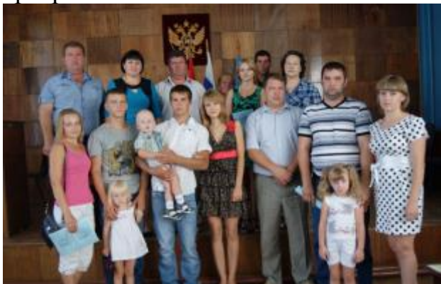
Участники программы 2014

29 ноября 2014 года было проведено заседание по развитию социальной сферы, где рассмотрены вопросы: «О ходе исполнения районной целевой программы «Обеспечение жильем молодых семей Ржаксинского района»,